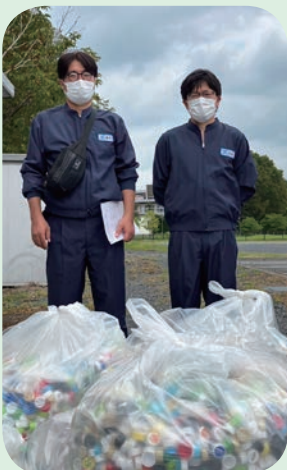
日本製紙リキッドパッケージ プロダクト株式会社様