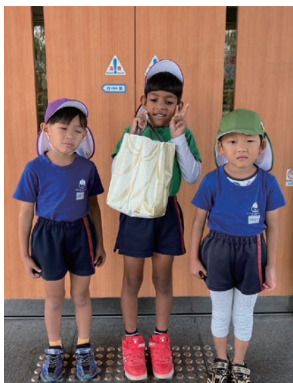
五霞幼稚園・保育園のみなさま