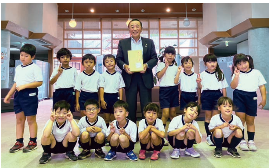
川妻認定こども園おひさまのみなさま