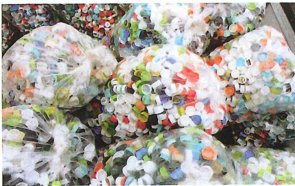
元栗橋ボランティア会のご寄付

回収場所：福祉センター「ひばりの里」、五霞町役場玄関自販機付近、中央公民館自販機付近