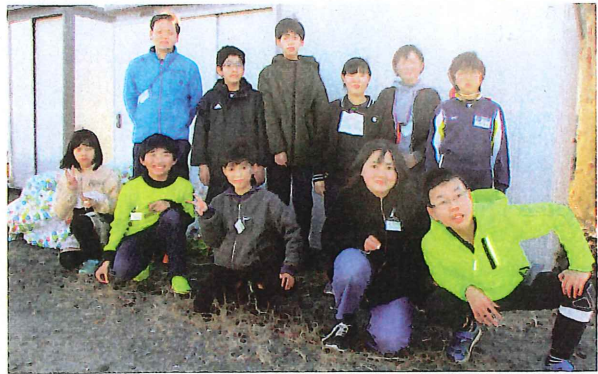
五霞東小学校JRC委員会のみなさま