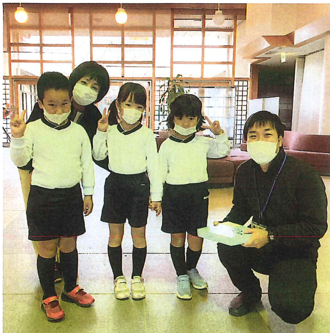
川妻認定こども園おひさまのみなさま