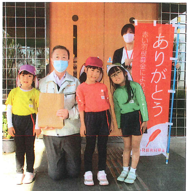
五霞幼稚園・保育園のみなさま