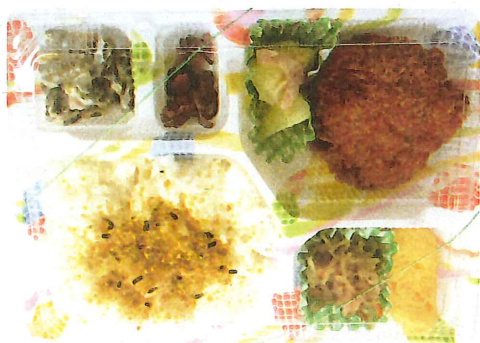
配食サービスの一例です