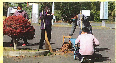
駐車場の落ち葉掃き